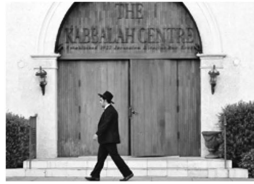
Центр каббалы Лос-Анджелеса

И все они «отвечают» за свое благополучие — здоровье, мудрость, богатство и т.д. Примечательно, что, как было указано выше, чтобы эта нить «работала» — ее обязательно нужно купить за деньги. Если взять обычную шерстяную нить и повязать ее — такой талисман не котируется. Кому же это надо? Стоит отметить, что глава центра каббалы — раввин Филип Берг — ловкий предприниматель, не упускающий ни одной возможности заработать деньги. Поэтому центр каббалы Лос-Анджелеса — мощное торговое предприятие. Там берут деньги за все.